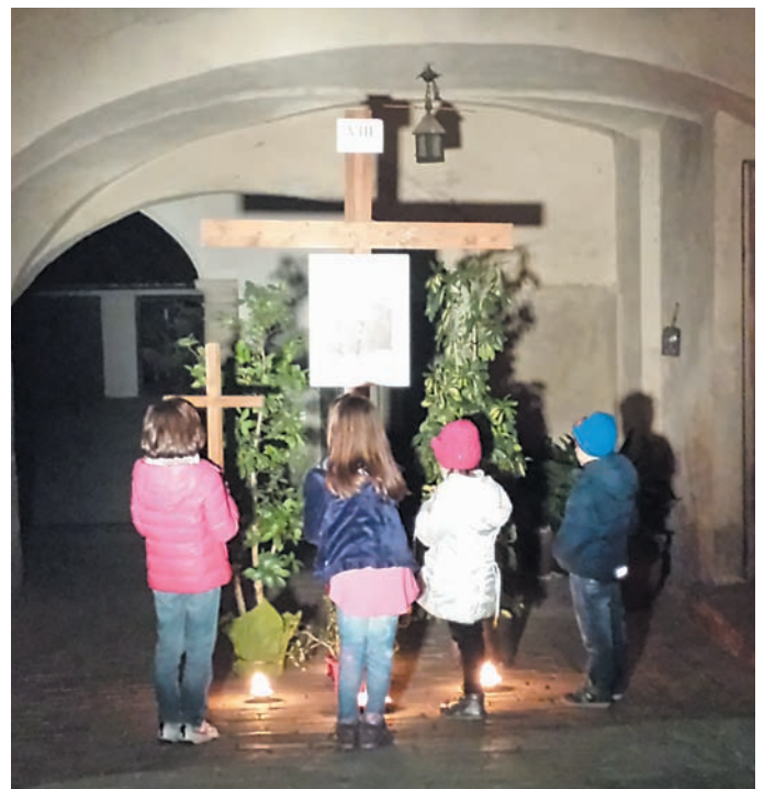
Starordinaria e devota partecipazione ogni venerdì di Quaresima alla Via Crucis di quartiere. Suggestivi anche gli allestimenti sui percorsi.