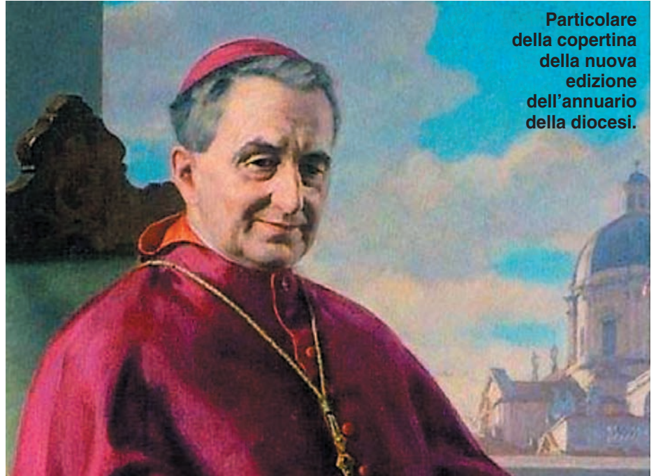
Particolare della copertina della nuova edizione dell'annuario della diocesi.

Ai tempi del vescovo Tredici non esisteva ancora un «Annuario della Diocesi» e la Diocesi era scritta, descritta e definita dalle segrete carte curiali, ma al vescovo, soprattutto a quel vescovo, nulla sfuggiva e ogni problema trovava la sua attenzione e la sua partecipazione. C'era anche abbondanza di «materia prima» - seminario affollato e preti novelli in buona quantità ogni anno -, ragion per cui le parrocchie potevano sempre far conto su preti addirittura in esubero; c'erano in calendario meno santi e meno beati, ma solo perché a Roma il tempo dei Papi disposti a sfidare le lungaggini vaticane non era ancora scoccato; c'erano anche meno vescovi bresciani di