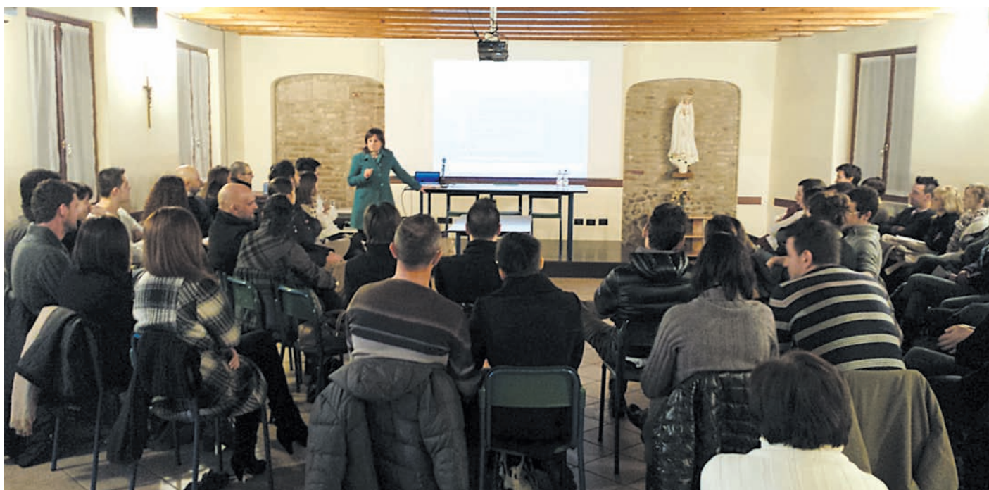
Partecipazione attenta e soddisfazione piena per le 23 coppie di fidanzati presenti al corso di preparazione al matrimonio.