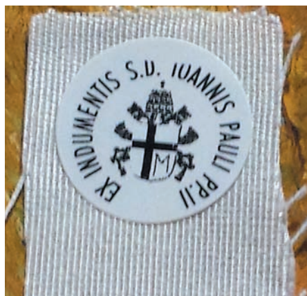
Dono di padre Silvano al parroco e alla parrocchia.

Il 13 gennaio 1964 fu nominato Arcivescovo di Cracovia da Paolo VI che lo creò Cardinale il 26 giugno 1967. Partecipò al Concilio Vaticano II (1962-65) con un contributo importante nell'elaborazione della costituzione Gaudium et spes. Il Cardinale Wojtyła prese parte anche alle 5 assemblee del