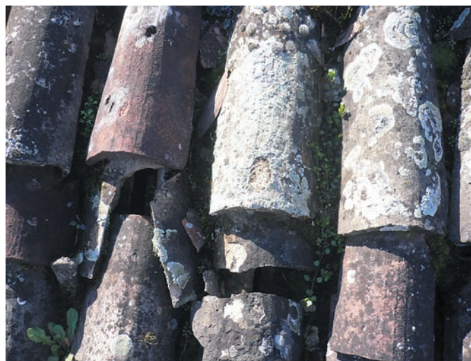
Cantieri sempre aperti in parrocchia: è stato ristrutturato urgentemente il tetto del ritrovo.