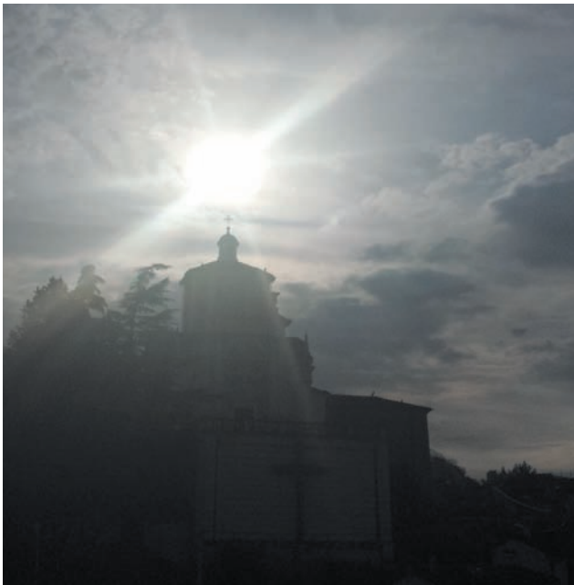
Il sole luminoso e raggiante si posa sull'Immacolata del Santuario all'inizio della Messa dell'Annunciazione del Signore alle 8,35 del 25 marzo. Come lei accolse nel grembo e donò a noi Gesù luce del mondo, così ci invita a divenire noi ostensori dell'eucarestia amata, accolta e donata.

Quando la natura partecipa alla liturgia del cielo non mancano i motivi di stupore, manca la capacità di guardare e di stupirci