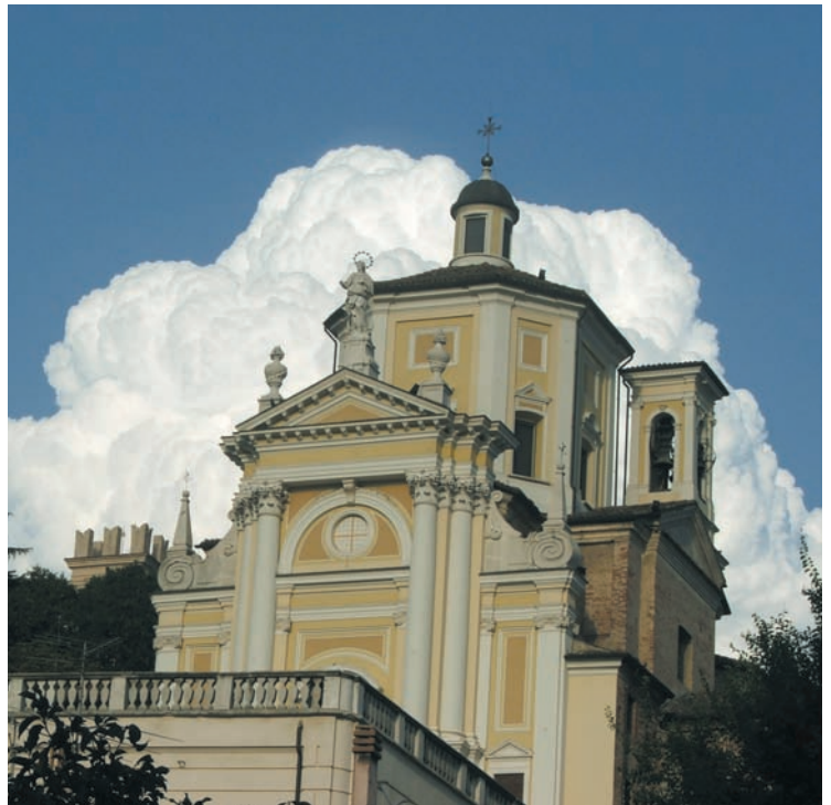
Il cielo anticipa e partecipa alla festa: così si presentava alle ore 17 il Santuario alla vigilia dell'Assunta il 14-08-2008.